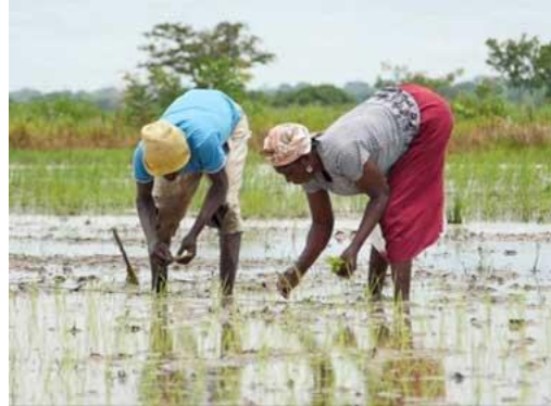
Ein Reisfeld in Ghana

Doch in der letzten Zeit gibt es Probleme, denn durch den Klimawandel hat sich das Wetter verändert. In manchen Regionen regnet es fast gar nicht mehr, in anderen viel stärker als früher. Außerdem wird es immer wärmer. Dadurch können die Bauern immer weniger ernten und kaum noch Geld verdienen.