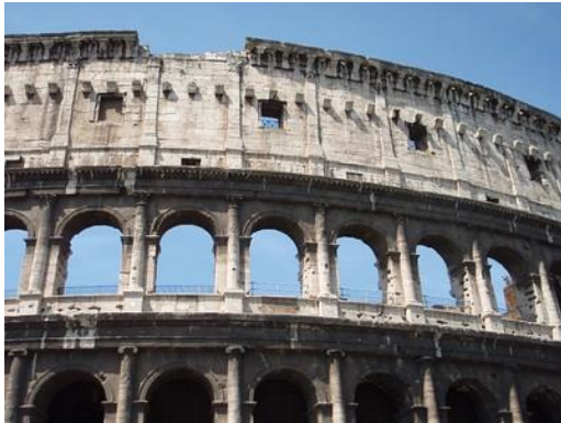
Das Kolosseum in Rom

Hast du schon mal etwas vom Kolosseum in Rom gehört? Das Kolosseum ist ein Amphitheater 3 , das im antiken Rom erbaut wurde und als Wahrzeichen der italienischen Hauptstadt gilt. Es hat einen großen historischen und archäologischen Wert, weshalb es auch im Jahr 2007 zu einem der Sieben Weltwunder der Neuzeit erklärt wurde. Doch das Kolosseum droht Opfer des Klimawandels zu werden, denn Italien zählt zu den Ländern in Südeuropa, die besonders stark mit den Folgen des Klimawandels zu kämpfen haben: es gibt mittlerweile immer wieder sehr starken Regen, Stürme und Tornados sowie sehr hohe Temperaturen, die zu Dürren führen.