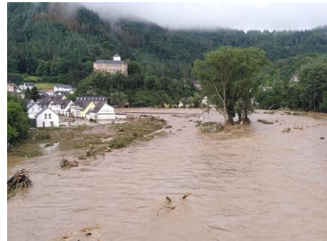
Hochwasser in Altenahr.

So kam es auch im Juli 2021 im Ahrtal und anderen Tälern des deutschen Mittelgebirges durch starke Niederschläge zu gefährlichen Sturzfluten. Durch extrem hohe Mengen an Regen stiegen viele Bäche und Flüsse plötzlich an, was zu extremen Überschwemmungen mit enormen Schäden führte. Durch die Fluten mussten viele ihre Häuser verlassen, so auch Dilsad und ihre Familie. Sie konnten sich glücklicherweise in einen Nachbarort retten. Als sie nach dem Hochwasser wieder zu ihrem Zuhause zurückkehrten, war vieles zerstört und kaputt. Die Familie will ihr Zuhause jedoch nicht aufgeben und versucht mit Unterstützung von Geldspenden und Freunden alles wieder aufzubauen. Andere Betroffene können oder möchten in ihr zerstörtes Zuhause nicht mehr zurückkehren.