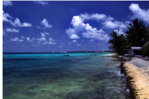
Tuvalu besteht aus kleinen Inseln. Alle Bewohner*innen leben direkt am Meer.

Durch den Klimawandel steigt das Meer immer höher, immer öfter gibt es Überschwemmungen. Früher hätte Bikenibeu Paeniu nicht geglaubt, dass die Menschen Tuvalu irgendwann verlassen müssten. „Aber heute sehe ich, dass die Industrieländer nichts gegen den Klimawandel unternehmen. Ich glaube, dass Tuvalu früher oder später unter Wasser stehen wird.“