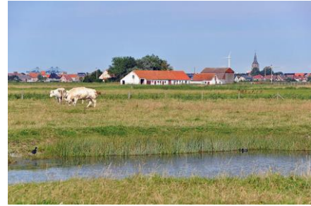
Teile des Landes liegen unter dem Meeresspiegel.

Eigentlich gibt es einen Deich, der das Land vor Überschwemmungen schützt. Doch durch den Klimawandel kann es in den Niederlanden immer häufiger starken Regen und dadurch Hochwasser geben. Durch das viele Wasser wird der Druck gegen die Deiche zu stark: Sie könnten brechen. Deshalb soll das Wasser mehr Platz bekommen. An vielen Flüssen zum Beispiel werden Deiche versetzt. So wird bei Hochwasser zwar mehr Land überschwemmt, aber dafür drückt das Wasser nicht mehr so stark gegen die Deiche. Die Menschen, deren Land überschwemmt wird, müssen umziehen: Entweder in eine andere Gegend oder auf einen kleinen Hügel, der extra dafür gebaut wird.